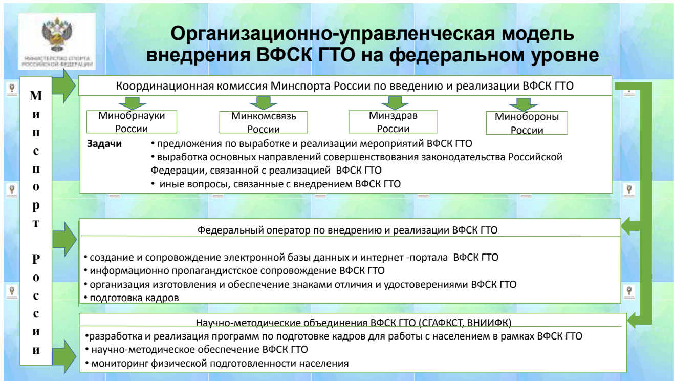
Рис. 1. Модель управления процессом внедрения комплекса ГТО на федеральном уровне

Наиболее близким к непосредственной работе с населением звеном в системе взаимодействия при управлении сферой физической культуры и спорта в регионе является муниципальный уровень.